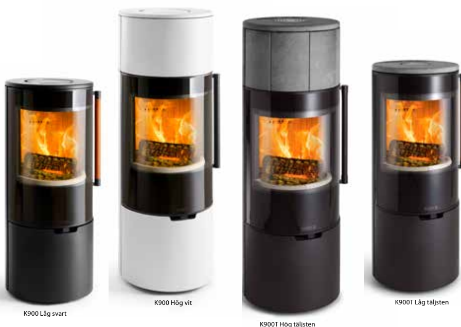
K900 Låg svart