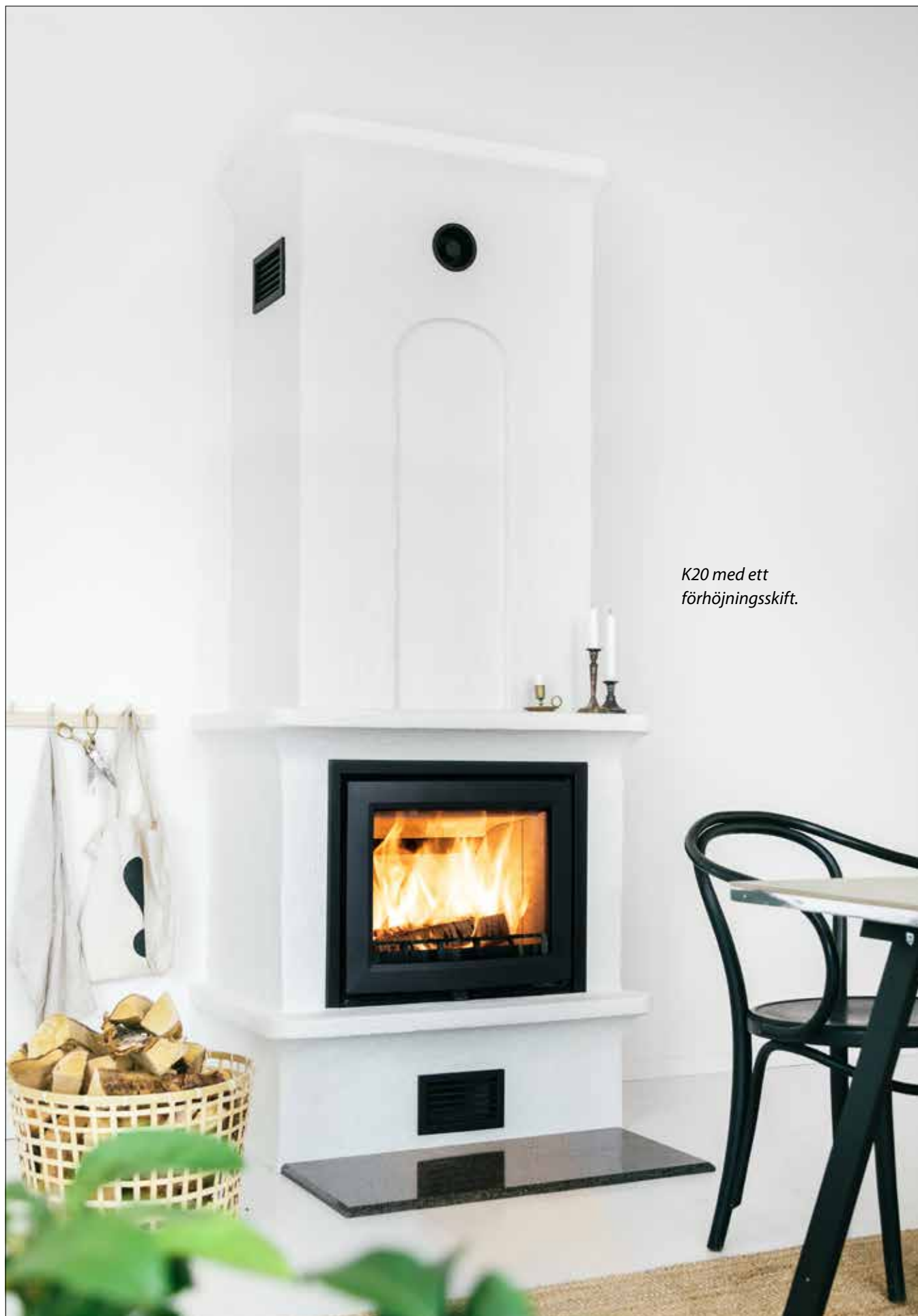
K20 med ett förhöjningskift.